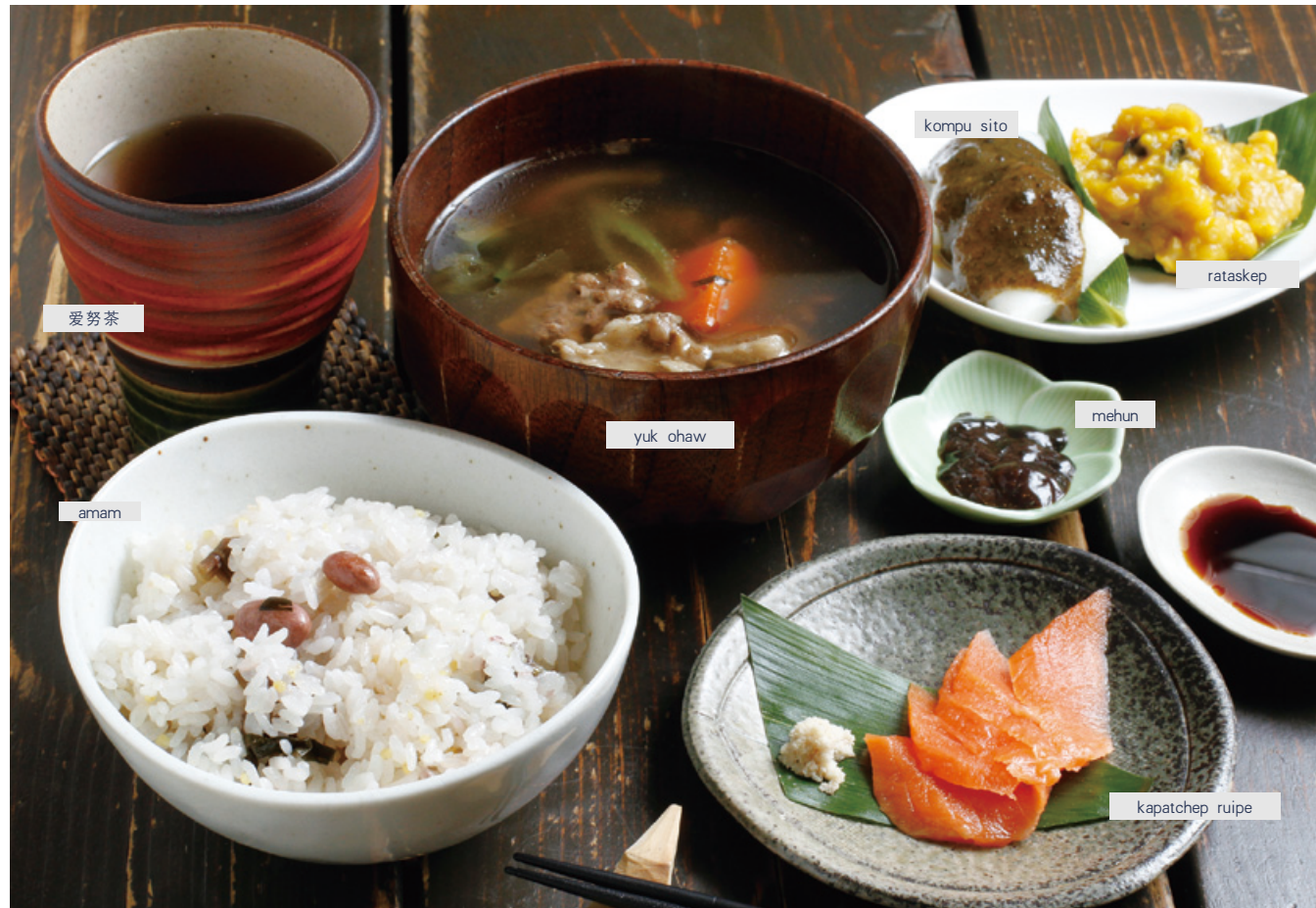
※根据季节的不同提供的饮食会有变化。